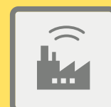
ГУДКИ ПРЕДПРИЯТИЙ И ТРАНСПОРТНЫХ СРЕДСТВ